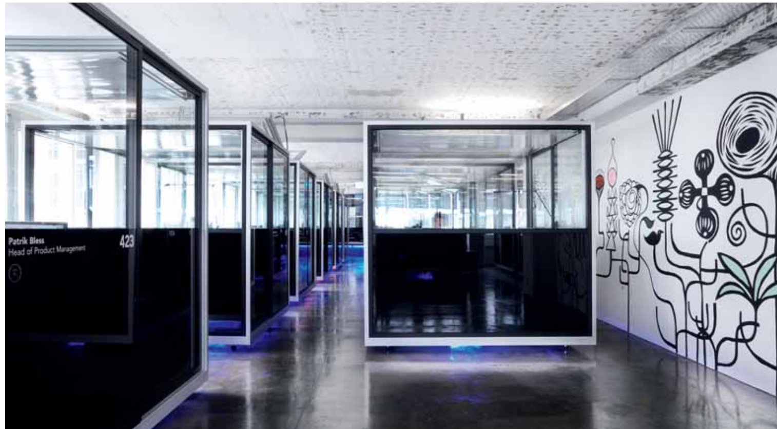
Gute Ideen und Kreativität brauchen das entsprechende Umfeld, um wachsen und gedeihen zu können: das Headoffice von Open Systems in Zürich.