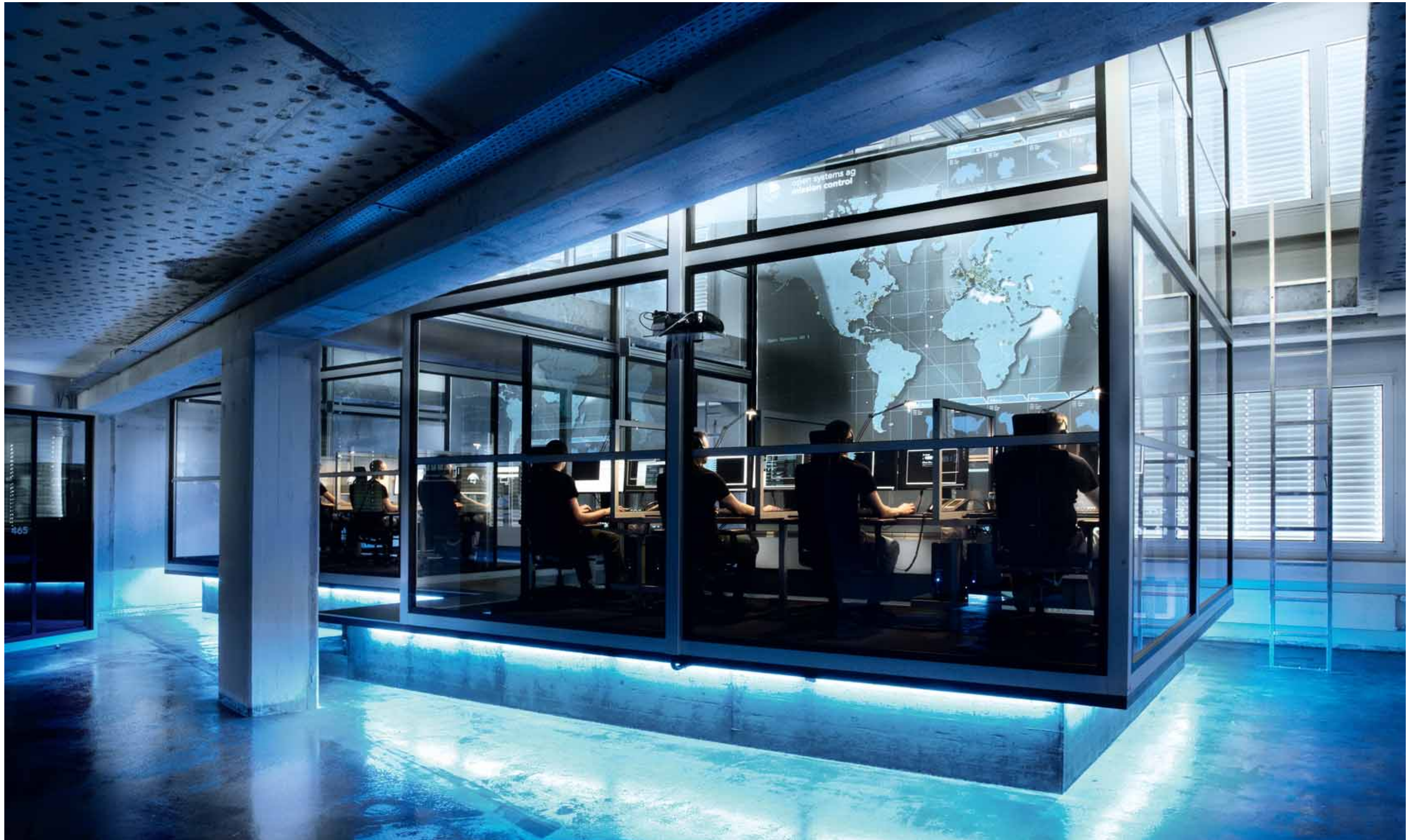
Im Sicherheitszentrum Mission Control von Open Systems in Zürich überwachen und managen Sicherheitsingenieure die Netzwerke rund um die Uhr.